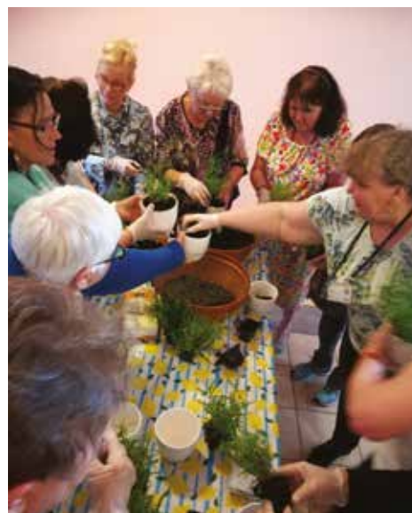
Pora na Giszowieckiego Seniora

Projekt pozwolił pokazać jak silna jest grupa senioralna w dzielnicy oraz jak dużą ma potrzebę aktywności. Każdy z seniorów nauczył się korzystać z mediów społecznościowych dzięki dedykowanej inicjatywie grupie senioralnej oraz założył mobilną Katowicką Kartę Mieszkańca. Z inicjatywy skorzystało około 70 osób.