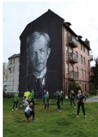
Inicjatywa lokalna „Bogucice – Aktywnie Razem”