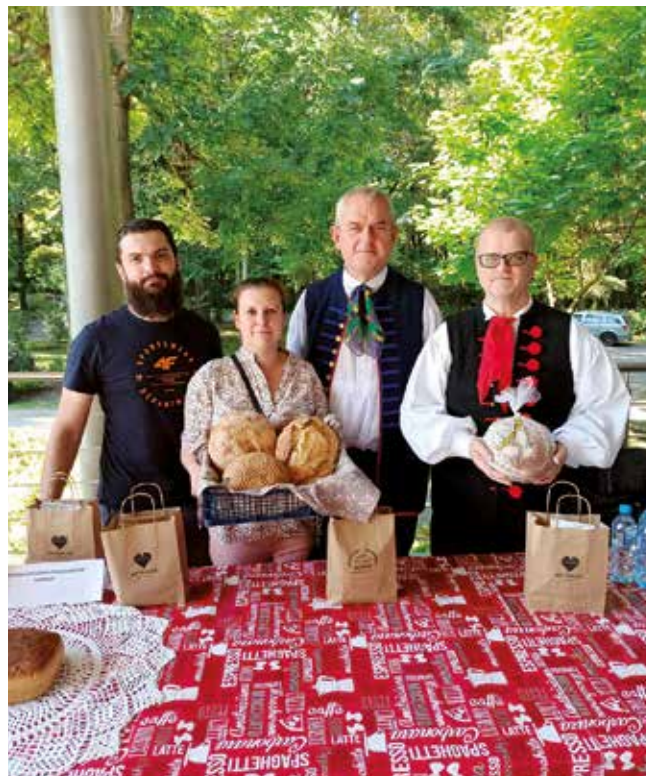
Inicjatywa lokalna „Łączy nas chleb”

Jeśli inicjatywa lokalna zostanie przyjęta do realizacji, wspólnie z pracownikiem Urzędu Miasta Katowice lub jednostki miejskiej doprecyzujecie kosztorys i harmonogram, a następnie zostanie podpisana umowa. Na tym etapie każda ze stron może odstąpić od podpisania umowy, jeżeli uzna,