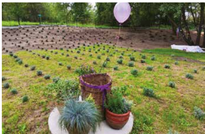
Inicjatywa lokalna „Lawendowy Ogród Katowic”

Treść uchwały i zarządzenia jest dostępna w Biuletynie Informacji Publicznej. Wzór wniosku o inicjatywę lokalną oraz inne szczegółowe informacje można znaleźć na stronie internetowej: www.katowice.eu/inicjatywa-lokalna