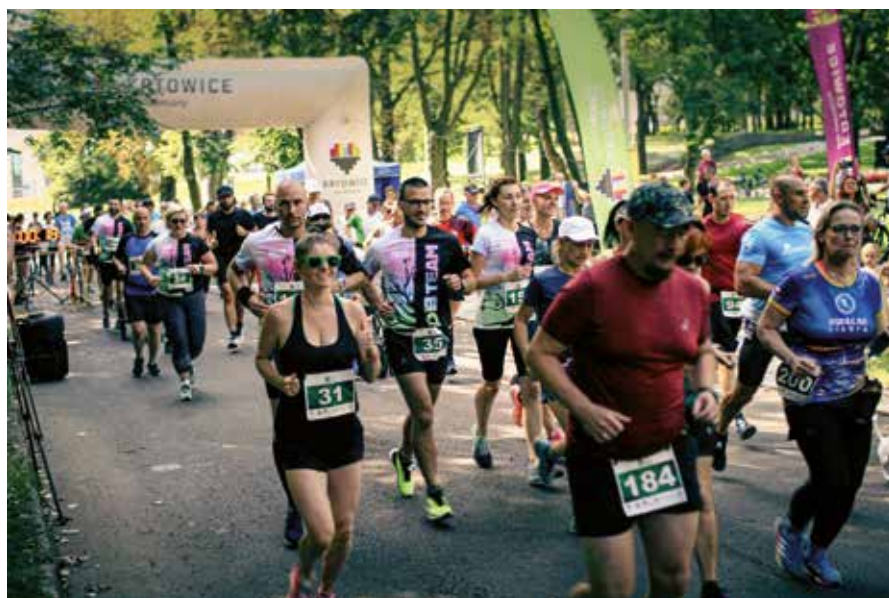
II Bieg dookoła Bogucice w ramach Inicjatywy lokalnej „Bogucice – Aktywnie Razem”

Np. przy remoncie podwórka mieszkańcy mogą wykonać prace porządkowe, po remoncie zadbać o zieleni albo zorganizować piknik integracyjny, na który przyniosą upieczone przez siebie ciasta.