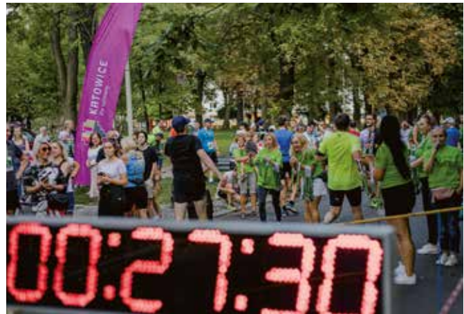
II Bieg dookoła Bogucic w ramach Inicjatywy lokalnej „Bogucice – Aktywnie Razem”