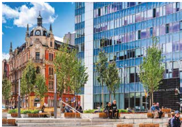
Urząd Miasta Katowice, Rynek 1

Adres: 40-006 Katowice, ul. Warszawska 4 Telefon: 32 259 36 24 e-mail: rm@katowice.eu Zakres inicjatyw lokalnych: działalności wspomagającej rozwój wspólnot i społeczności lokalnych.