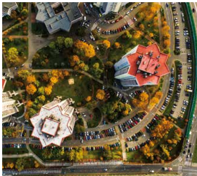
Osiedle Gwiazdy, fot. UM Katowice

Informacje na temat posiedzeń i dyżurów Rad Dzielnic można znaleźć w BIP bip.katowice.eu/RadaMiasta/Dzielnice