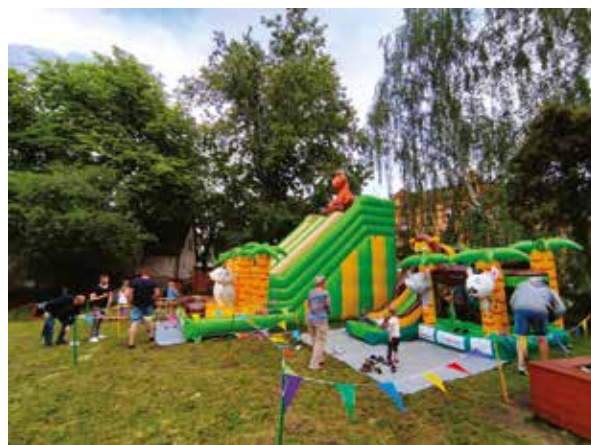
Dzień Dziecka na Załęskich Tarasach – Festyn Mieszkańców dzielnicy Załęże

rodzinnych, krzewienia zdrowego stylu życia. Działania wsparły rodziców w procesie wychowawczym, wskazując im alternatywny dla codzienności sposób spędzania czasu z dziećmi. Załęskie dzieci nauczyły się współdziałania, aktywnie wypoczęły oraz nawiązały nowe i utrwaliły dotychczasowe znajomości.