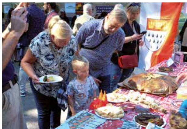
Inicjatywa lokalna „Łączy nas chleb”

Tak. Wymagane jest jednak pisemne oświadczenie zarządcy obiektu o wyrażeniu zgody na przeprowadzenie zgłaszanej inicjatywy lokalnej. Jeśli inicjatywa lokalna będzie przyjęta do realizacji, zostanie podpisane porozumienie o współpracy z zarządem wspólnoty mieszkaniowej.